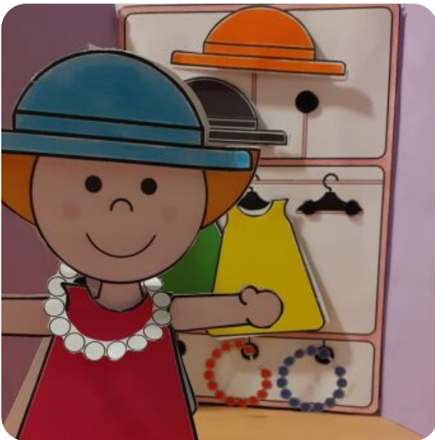
L'armadio di Linn

Ecco come altri bambini hanno già usato i nostri kit!